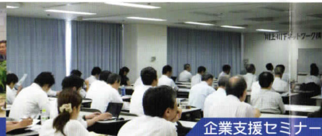
企業支援セミナー