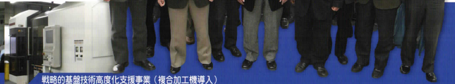
戦略的基盤技術高度化支援事業（複合加工機導入）