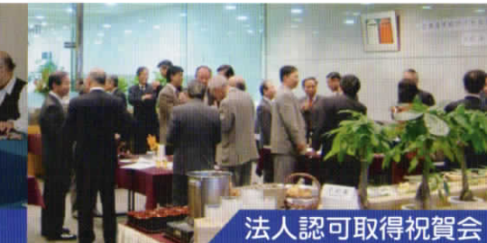
法人認可取得祝賀会